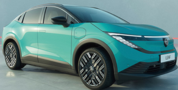
Der neue Nissan Leaf

Störtebeker Festspiele – unterstützt durch die Nissan Deutschland GmbH.