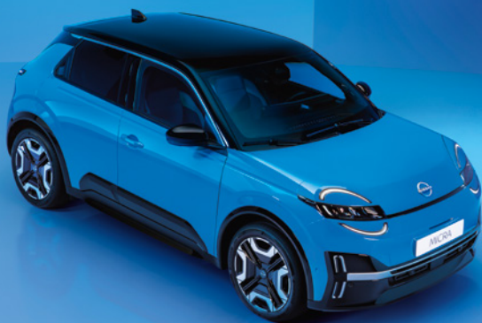
Der neue Nissan Micra